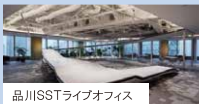
品川SSTライブオフィス