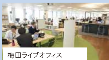
梅田ライブオフィス