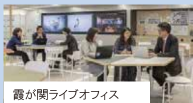
霞が関ライブオフィス