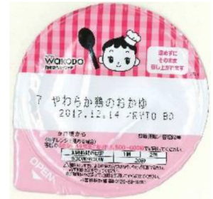
「やわらか鶏のおかゆ」 賞味期限2017.12.14の 表示があるものが当該

この度、ホームズ新山下店・ホームズ中野本店・ホームズ足立小台店・ホームズ草加舎人店の4店舗で販売を致しました、アサヒグループ食品が和光堂ブランドで展開する『栄養マルシェ鶏とおさかなのベビーランチ』、『栄養マルシェ和野菜のベビーランチ』の商品の一部に青色の樹脂片が混入していることがわかりましたので、下記対象商品を自主回収させていただきます。