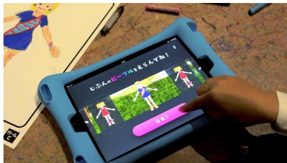
「あそぶ！天才プログラミング」©チームラボ

プログラムは、タブレットを操作しブロックを組み合わせるので、直感的に操作して遊びながらプログラミング的思考を学ぶことができ、同時に共同的な創造性・論理的思考力・問題解決力が身につきます。